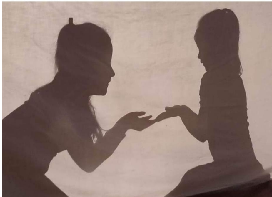
子どもが子どもに魔法を渡す

「会議から一週間たって、私たちの不思議の瞬間はまだ、内側と外側の両方で響き続けています。」--子どもたちのフォーカシング顧問グループ